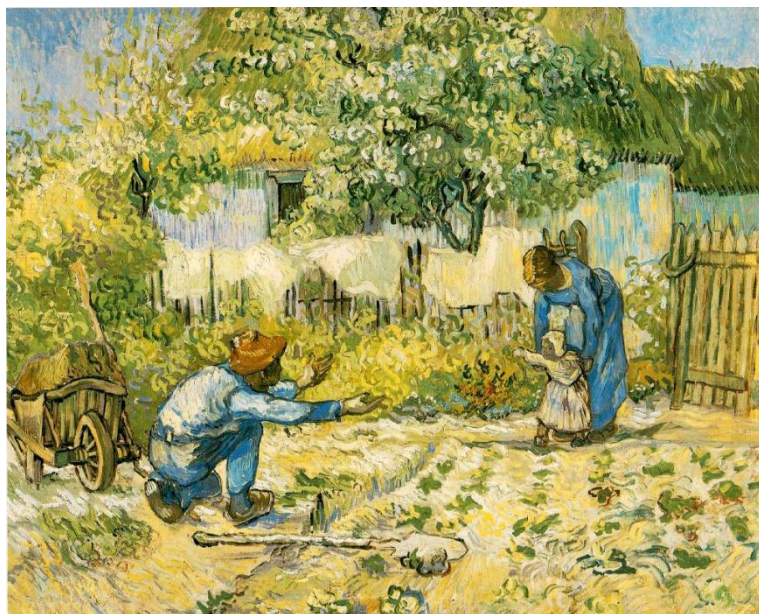
Vincent Van Gogh

“Con i bambini capirsi è semplice. Quando ti prendono per mano, hanno già scelto di fidarsi di te.”