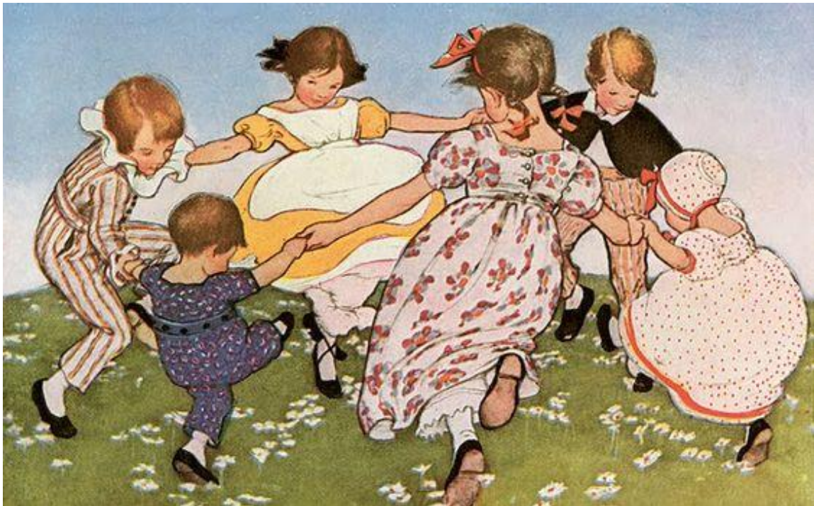
Jessie Wilcox Smith

Il nido si avvale inoltre della collaborazione, sempre in presenza e sotto la supervisione e la responsabilità delle educatrici, di volontarie regolarmente iscritte all'Associazione Volontari Scuole di Varese.